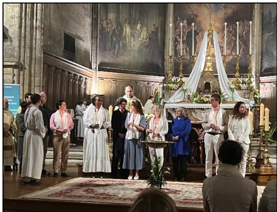
Baptême à la vigile Pascale