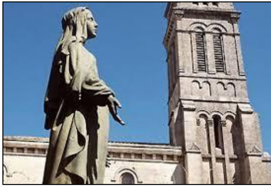
Notre-Dame de Beauregard, Orgon.