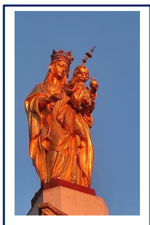
Vierge du square des jardins à Salon

« Ancrés dans le cœur de Jésus Christ, remplissons ce monde d'espérance »