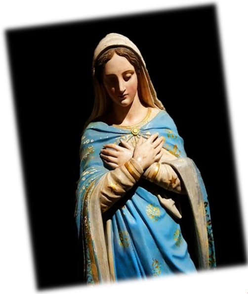
Marie mère de Dieu