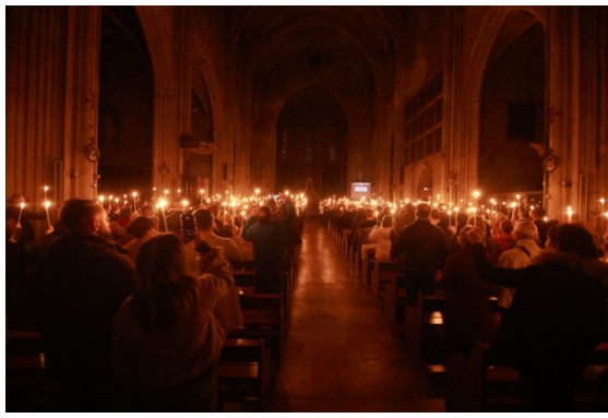
Vigile Pascale 2026 – Collégiale Saint-Laurent